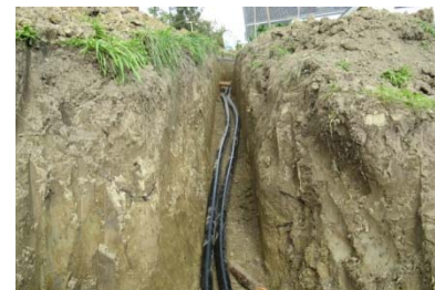
L'eau chaude s'écoule par des conduites à distance vers le consommateur

Le bois de la région, réduit en copeaux, est brûlé dans la centrale. L'eau chaude produite parvient aux immeubles par le biais de conduites à distance (voir image). A cet effet, on utilise deux tuyaux: l'un amène l'eau chaude et l'autre évacue l'eau refroidie pour la reconduire vers la centrale.